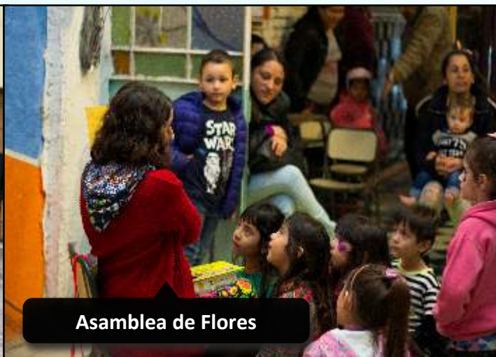
Asamblea de Flores