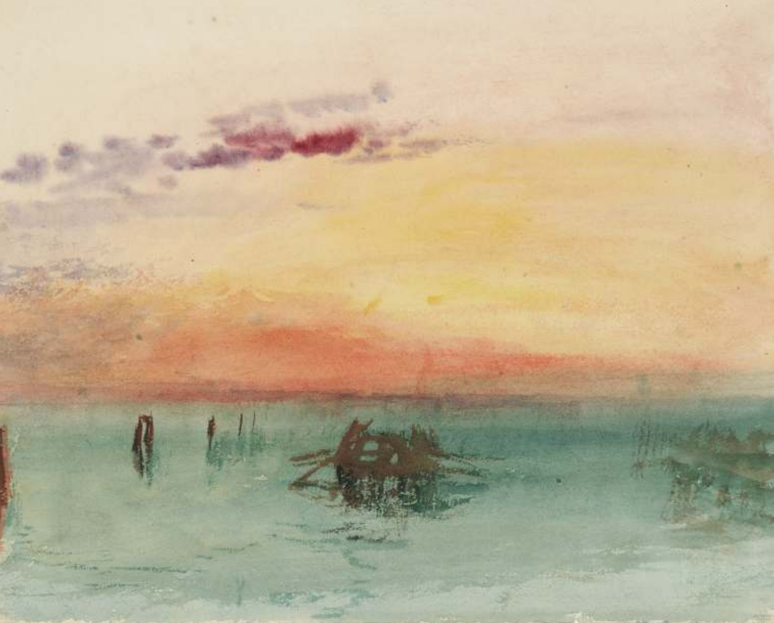
Venecia, vista a través de la laguna en el crepúsculo, 1840 Acuarela sobre papel, 24,4 x 30,4 cm