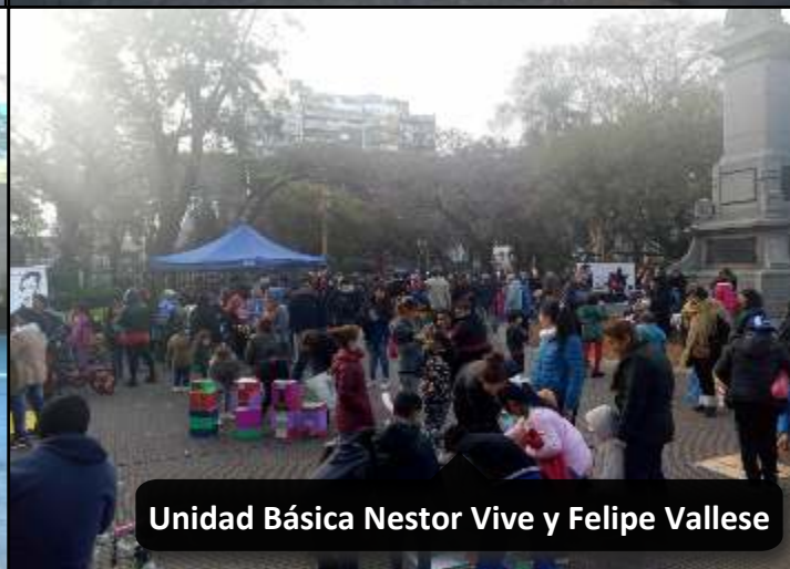
Unidad Básica Nestor Vive y Felipe Vallese