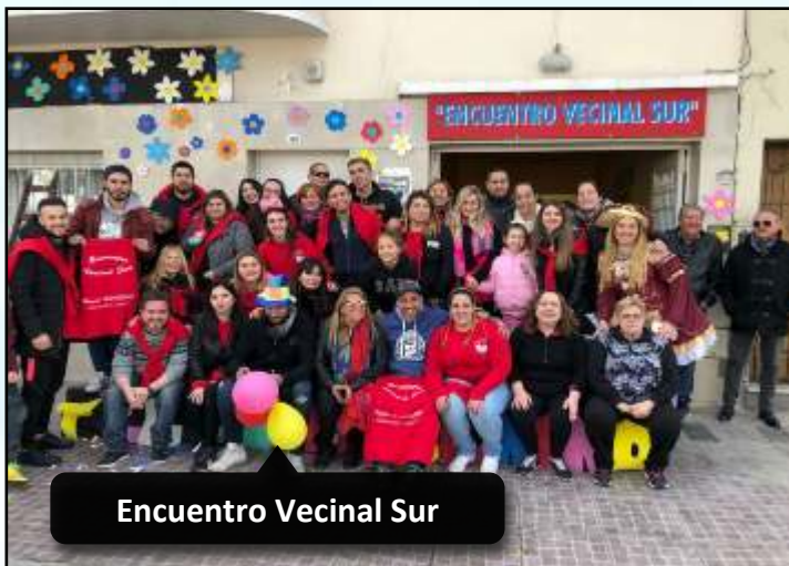
Encuentro Vecinal Sur

Instantáneas fotográficas del trabajo realizado por las organizaciones e instituciones para celebrar la niñez en la Comuna 7. Unas serias bocanadas de alegría, solidaridad, cooperación social y juego.