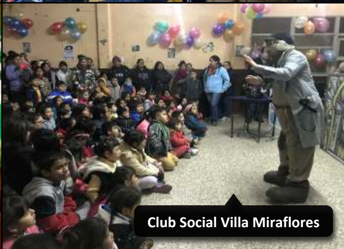
Club Social Villa Miraflores