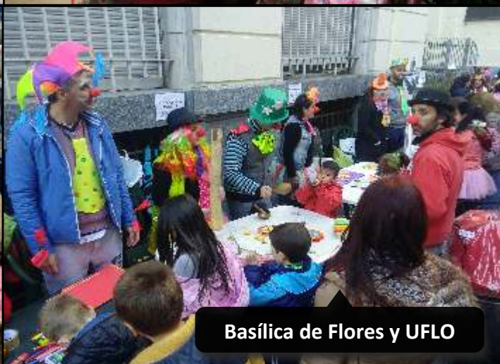
Basílica de Flores y UFLO