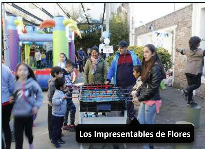
Los Impresentables de Flores