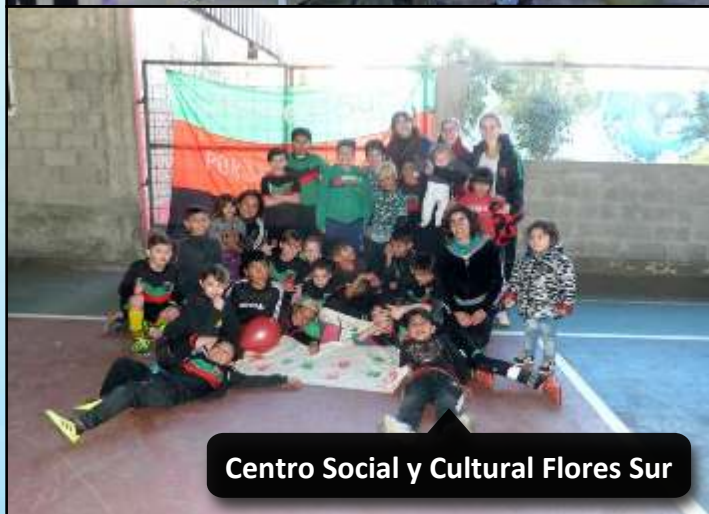
Centro Social y Cultural Flores Sur