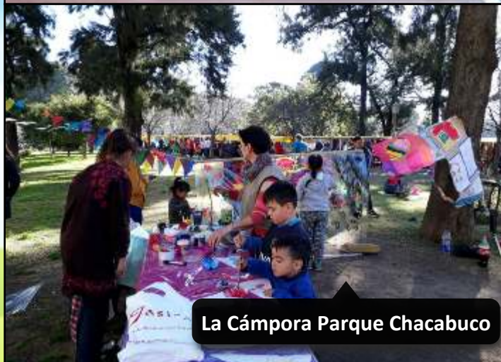
La C mpora Parque Chacabuco