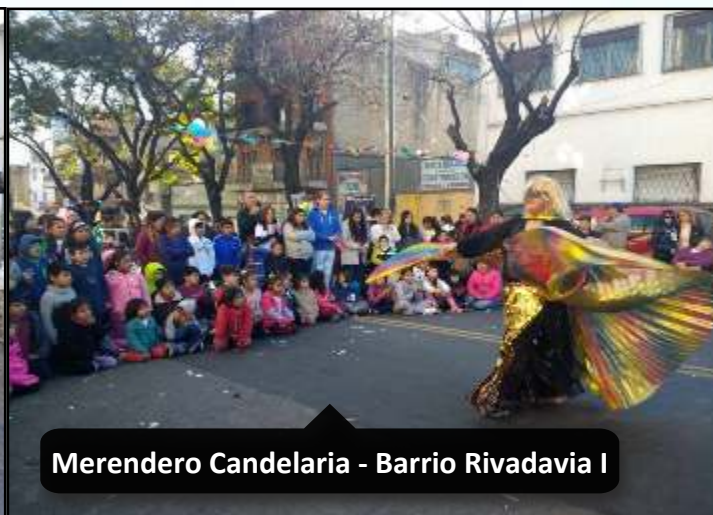
Merendero Candelaria - Barrio Rivadavia I