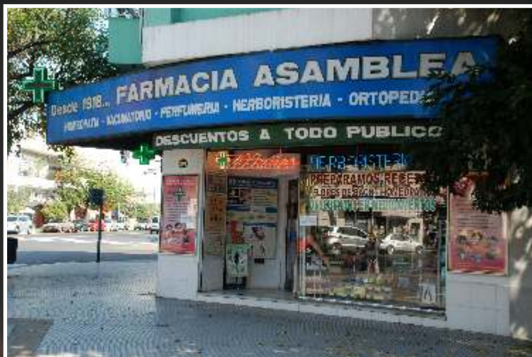
LOS 100 AÑOS DE UN ÍCONO DEL BARRIO

El mayor coleccionista de Sandro es del Barrio Parque Chacabuco