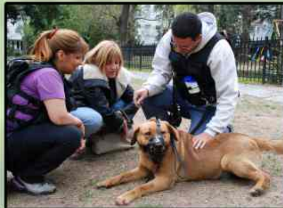
Mateo en plena clase!!! (está en adiestramiento para adopción)

¿Qué necesitan estas asociaciones? Donaciones económicas, colaboraciones, casas de tránsito, voluntarios, adoptantes... Este mes es el Día de la Mascota, gran excusa para colaborar!!! Contactate!!!