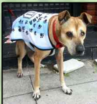
Miguelito antes y después (se fue hace un tiempo pero lo recordarán x siempre)