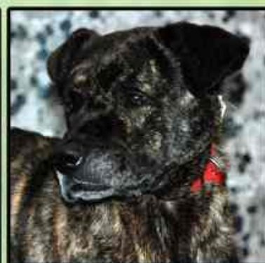
Alfonsina , en adopción. Argentó , en adopción. Doris , en adopción. Maluma , en adopción.

¿Cómo es el antes y el después de su trabajo?