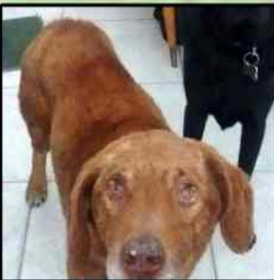
Moncho antes y después (está en adiestramiento para adopción)