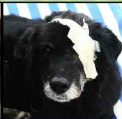
Negri antes y después (está en tránsito hasta curarse)