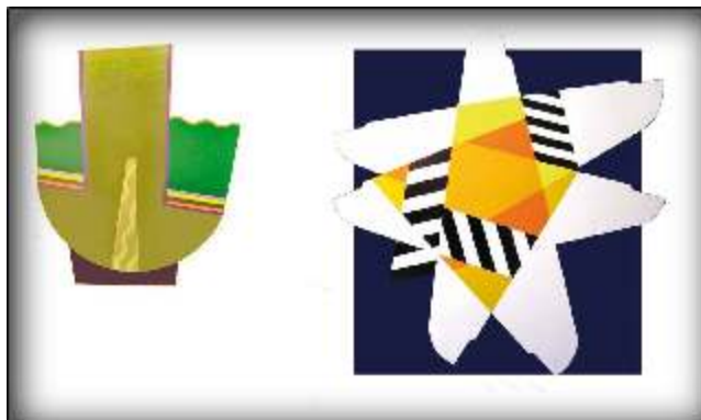
Obra Nº 7: Equilibrio inestable y Nº17: Madres