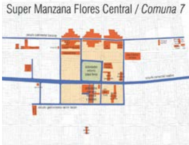
UN EJEMPLO DEL PROYECTO VOTADO COMO "SUPERMANZANA"

Había que votar 2 ideas estratégicas para la Comuna N° 7.