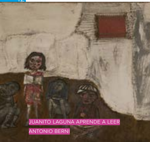
JUANITO LAGUNA APRENDE A LEER ANTONIO BERNI